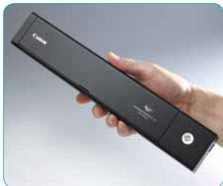
Ultradelgado y ligero