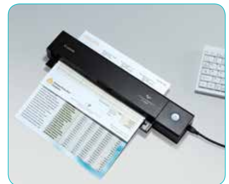
Alimentador de documentos de 10 hojas con escaneado a doble cara

Los usuarios domésticos también disfrutarán del P-208II, dado que es perfecto para escanear facturas del hogar, mientras que la función de modo de imagen es idónea para escanear con precisión fotografías antiguas.